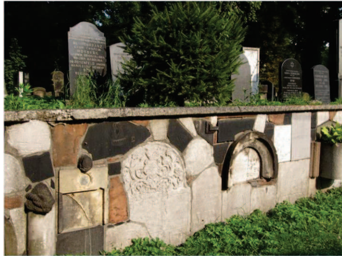
Jüdischer Friedhof in Kraków

Außerdem organisierte der Beirat in den letzten beiden Jahren Studienreisen nach Brüssel und Poznań. So auch dieses Jahr... Katowice, Auschwitz, Kraków - im Sommersemester 2012 ging die Reise nach Polen auf den Spuren jüdischen Lebens damals und heute.