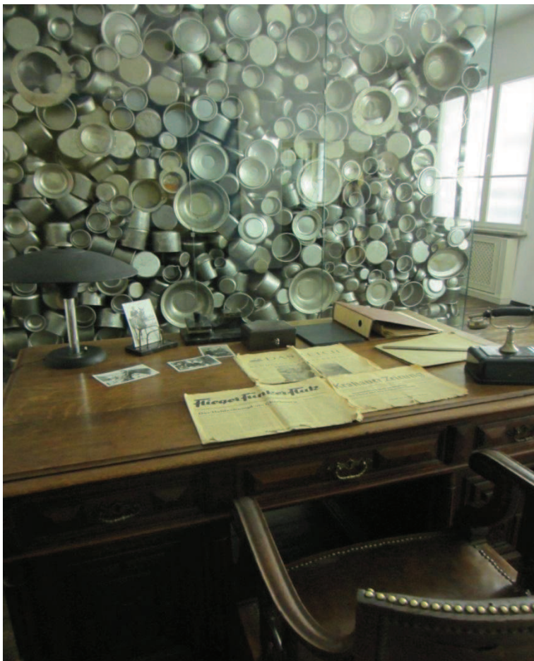
Rekonstruktion des Büros von Oskar Schindler