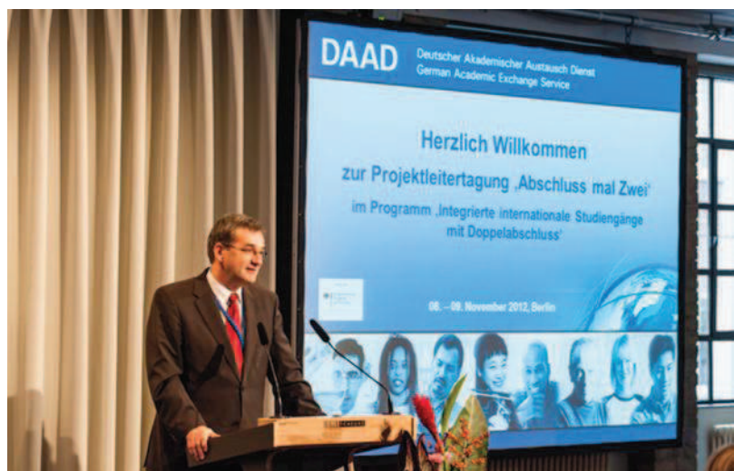
Eroffnung der DAAD Tagung © DAAD/D. Ausserhofer, R. Steuloff

Studiengange mit Doppelabschluss“ wurde 1999 aus der Taufe gehoben. Erklartes Hauptziel des Programms ist es, die Internationalisierung deutscher Hochschulen mittels der Implementierung sogenannter Double und Joint Degrees voranzutreiben. Dabei handelt es sich um gemeinsame Studiengange zweier (selten auch mehrerer) Hochschulen, deren Absolventen zum Studierendende jeweils ein Abschluss beider Kooperationspartner (Double Degree) oder